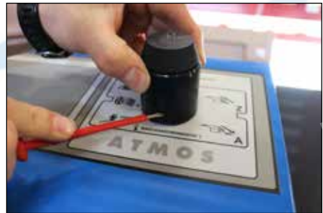
Schritt 2: Abnahme des ASU Timers vom Montagedeckel