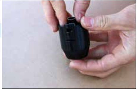
Schritt 6.1: Einsetzen des Trichters