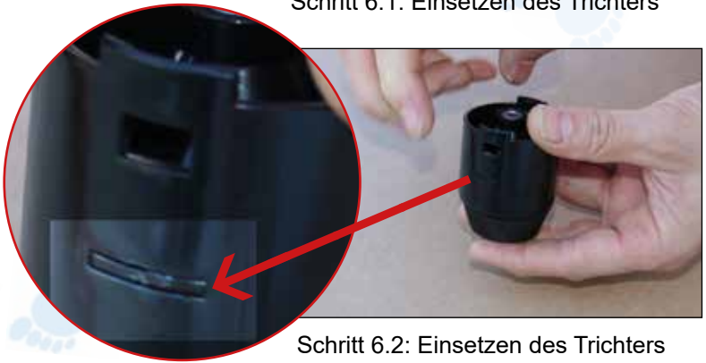
Schritt 6.2: Einsetzen des Trichters Der Trichter muss auf beiden Seiten im Gehäuse einrasten.