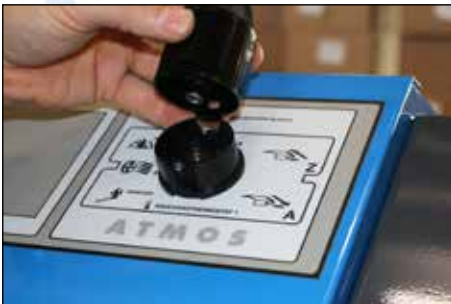
Schritt 7: Aufsetzen: wie unter Schritt 1 entnommen. Pfeilrichtung beach- ten.