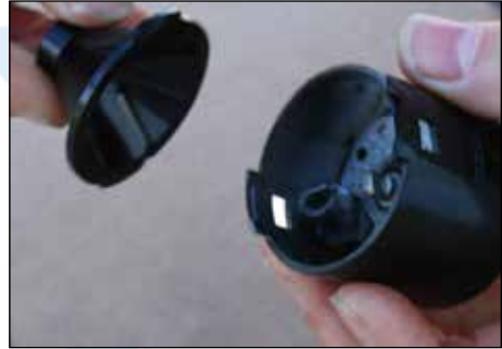
Schritt 4: den defekten Mitnehmer entfernen (dieser kann auch noch auf der Welle sitzen). Sollte dabei der Sprengring kaputt gehen, stellt dies kein Problem dar, da er nicht mehr benötigt wird.