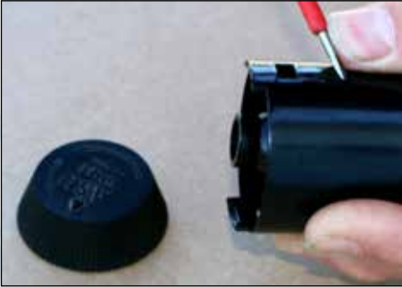
Schritt 3: Ausklinken des Trichters und nach dessen Entnahme...