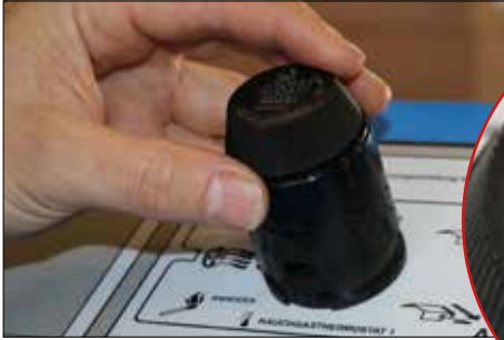
Schritt 1: ASU Timer in Position 11.30 Uhr bringen