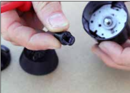
Schritt 4.1: Defekten Mitnehmer entfernen