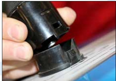
Schritt 2.2: Abziehen aus der Halterung