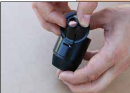
Schritt 6: Trichter waagrecht einführen, nicht verkanten.