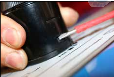
Schritt 2.1: Ausklinken aus der Halterung